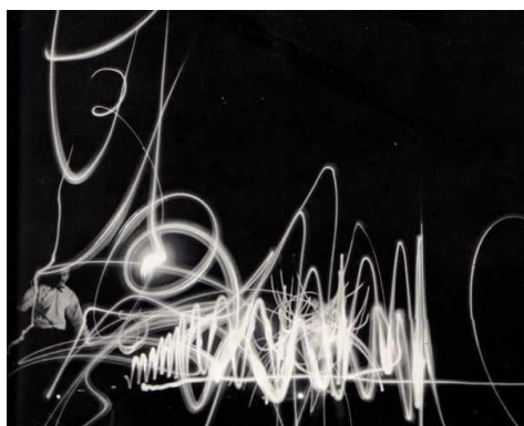
Georges Mathieu (1957)

Le peintre Georges Mathieu fit une photographie pour une couverture de magazine japonais dans les années 1950. L'artiste photographe Jacques Pugin fit plusieurs séries d'images avec cette technique en 1979 » (source : Wikipédia)