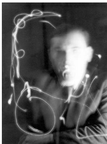
Man Ray ( A Man With Moving Light )