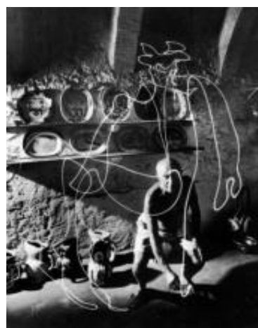
Gjon Mili et Pablo Picasso